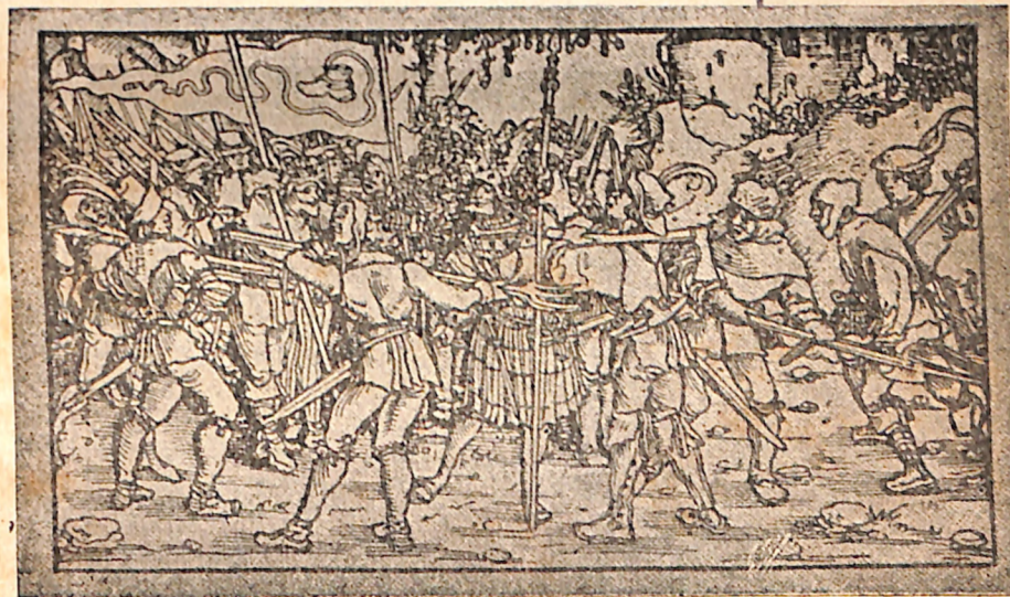
Campônios revolucionários da "Liga da Bota" (Bundschuh) aprisionam um fidalgo.