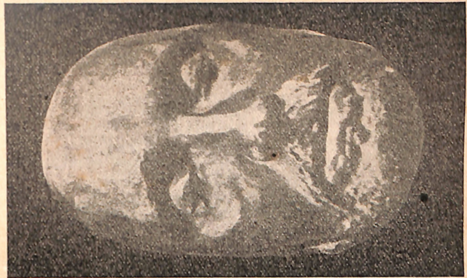
Máscara de Oliver Cromwell morto.

Neste lutador por amor do seu Deus, a fria sobriedade acadêmica das deduções de Calvino chameja transformada na cólera irreconciliável dum legítimo rebelde. Eis o que lhe empresta uma ascendência poderosíssima sobre a alma do povo escocês. "Há por lá um homem chamado Knox, cuja voz desperta em nós mais vida do que o soar de seiscentas trombetas!", relata ao seu ministro, o embaixador inglês na