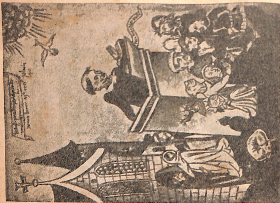
Bertoldo de Ratisbona pregando a penitência.