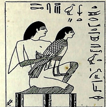
Histoire ancienne des peuples de l'Orient classique

dirons-nous avec tous les autres siècles passés et futurs. Mais voici un homme qui découvre le cycle, et tout devient clair : dans le mouvement apparent, le Soleil se lève à l'est, il monte jusqu'au sommet de sa course diurne, il décline, il se couche à l'ouest au point, et là il continue , mot immense qui donne la clé; il décrit son cycle, il passe au sommet de sa course nocturne, le sommet de la nuit, puis il revient et se présente à nouveau, comme hier, comme demain, à l'orient où il se lève sur ce jour tout neuf.