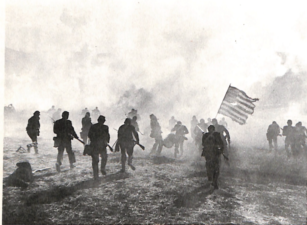
A la izquierda, en una escena de la película americana The Red Badge of Courage (1951), las tropas de la Unión avanzan para tomar una posición defendida por las fuerzas confederadas. El 14 de abril de 1865, Abraham Lincoln soñó con una victoria similar, que culminaba con la rendición del general confederado Joseph Johnston. Días antes, Lincoln había tenido otro sueño profético, en que vio su féretro solemnemente expuesto en la Casa Blanca después del asesinato (derecha).