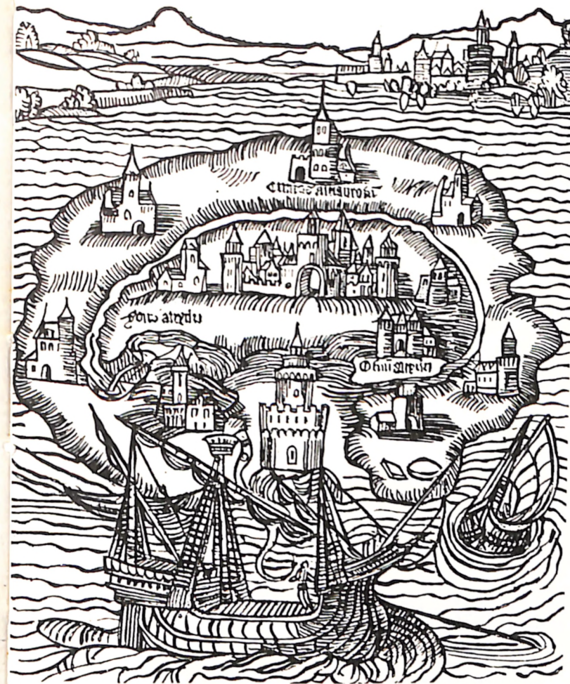
Arriba, frontispicio de Utopía (1516), donde el estadista inglés sir Thomas More describe un Estado ideal, con su propiedad comunal, tolerancia religiosa, etc. Hoy, tales sociedades «utópicas» se describen a menudo en relatos de viajes por el espacio o el tiempo. A la derecha, ilustración de uno de los primeros ejemplos de ciencia-ficción, A Plunge into Space (1891), por el inglés Robert Cromie, el relato de un viaje a Marte.

La vasta novela de Proust se refiere, naturalmente, a las gentes, pertenecientes en su