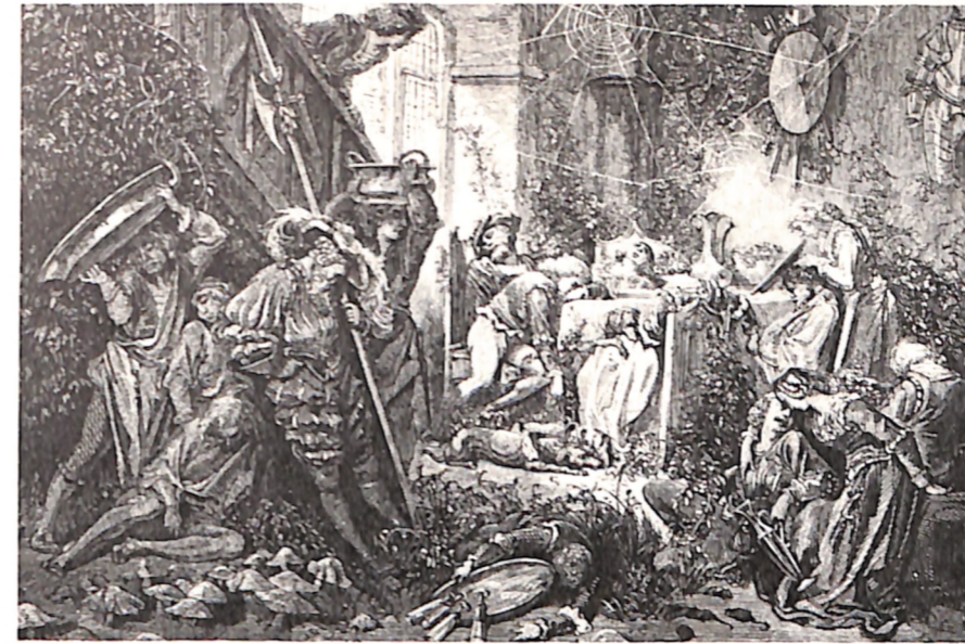
A la izquierda, castillo de la Bella Durmiente, ilustración hecha por el francés Gustave Doré del cuento de una princesa que se duerme durante cien años. En esta narración, como en otros muchos cuentos semejantes, el tratamiento del Tiempo y la duración se añaden a la «irrealidad» del mundo de los cuentos de hadas.

El segundo método se halla en novelistas altamente dramáticos, como Dickens y Dostoyevski. Imprimen a su tiempo impacientes sacudidas y luego, de pronto, reducen la marcha, para crear escenas tremendas, casi como si estuviesen a punto de escribir para el teatro. Dominando de tan magistral manera su tiempo, ora apresurándolo todo implacablemente, ora refrenándolo para pintar una escena, como si condujeran un coche a ochenta millas por hora y luego a diez, actúan sobre nuestros nervios, nos obligan a excitarnos y, con frecuencia, a experimentar extraños presentimientos. En un momento dado, estos novelistas parecen irreales; en otro momento, parecen más reales que la vida misma, mostrándonos cómo es realmente . (Los lectores que piensen que esto no es cierto respecto a Dickens, deben leer sus últimas novelas con atención más crítica.) Naturalmente, tales novelis-