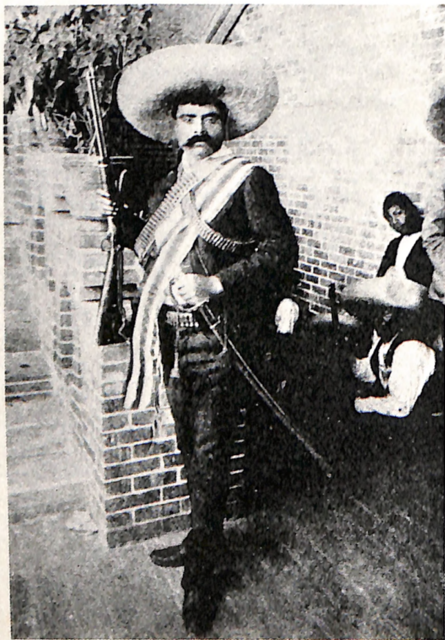
Abajo, el mejicano Emiliano Zapata, jefe de la «Legión de la Muerte», que se proponía devolver por la fuerza a los indios las tierras. Después del asesinato de Zapata, en 1919, muchos indios aseguraban que su jefe, como un héroe mitológico, todavía vivía y algún día volvería para guiarlos de nuevo.

Podemos calificar de cristiana a nuestra sociedad, podemos creer sinceramente que lo es, pero lo cierto es que tiene una base secular, y, digamos lo que digamos, la creemos gobernada, no por leyes divinas, sino por leyes políticas y económicas. A diferencia de hombres anteriores, no pensamos que nuestra sociedad esté contenida por creencias religiosas comunes y por grandes mitos. Nuestra vida cotidiana,