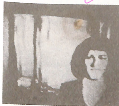
A dra. Swejen Salter, cientista falecida, comunica-se desde dezembro de 1987, via computador e mais tarde também via TV e telefone.

"Morri com 38 anos, em consequência de um acidente. A morte veio de repente e inesperadamente. Estava totalmente despreparada, e não me lembro de qualquer transição. Acordei numa espreguiçadeira, num quarto confortavelmente arrumado. Não conhecia a redondeza. Antes que pudesse dar uma olhada melhor, entrou um homem alto e bem apessoado, que se apresentou como Richard Francis Burton. Ele deu-me as boas-vindas e mostrou-me o mundo onde se encontra, de acordo com o tempo terreno, desde 1890. Senti-me feliz e em casa, todos eram amáveis e prestativos. Ainda assim, a adaptação não foi nada fácil. Não é fácil ajustar-se a uma nova vida."