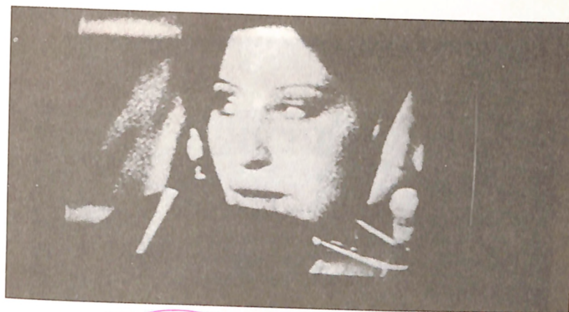
Ilustração 4: "Marie diante do Aparelho" seria a cientista Mme. Marie Curie (mais jovem) no seu laboratório do Além