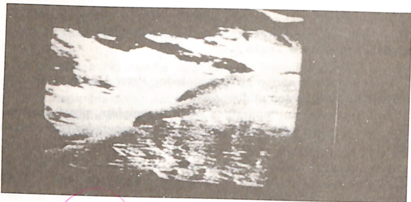
Ilustração 2: Marduk é um planeta fora do nosso sistema solar, com duas capas cobertas de neve (semelhantes aos nossos pólos)