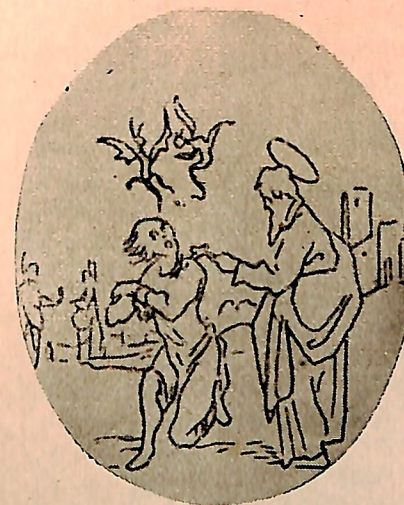
Fig. 22 — Cristo curando um possesso, cobertura de um Evangelho datado do século V, Biblioteca de Ravena. 48