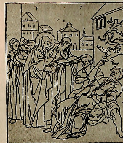
Fig. 24 — Santa Clara libertando uma mulher de cinco Demônios, gravura de Adam van Noort, século XVII. 48