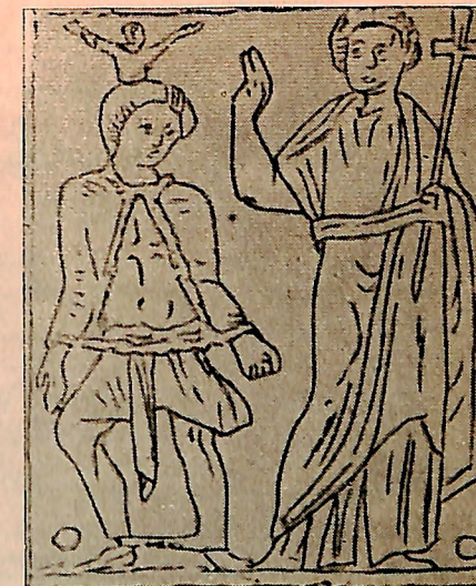
Fig. 23 — São Lino curando um possesso, gravura de Jacques Callot, século XVII. 48